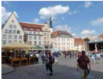
La plaza del Ayuntamiento

Evidentemente mi recorrido empezó por la ciudad vieja. Nada más llegar al albergue, como aún no podía entrar aún en mi habitación me recomendaron una visita turística gratuita de los Yellow Free Tours que empezaba a las 12 en la puerta de la oficina de turismo. La guía era una chica hiperactiva de unos veintitantos bastante simpática. Merece la pena para conocer gente y pasar un buen rato. Gratis del todo no es porque se suele dejar propina.