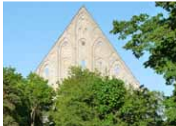
Ruinas del convento de Pirita