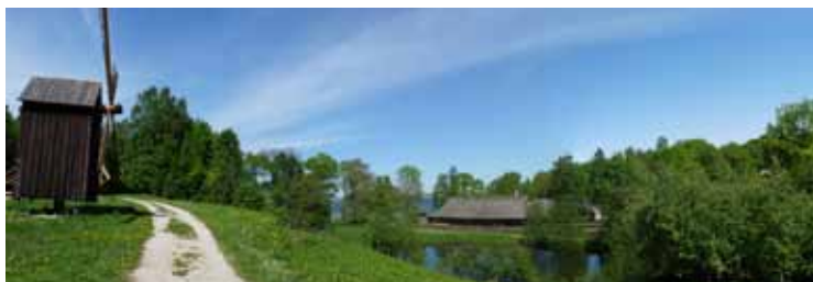
Museo al aire libre