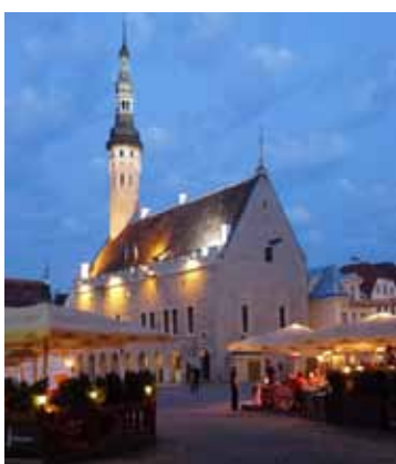
El Ayuntamiento de noche