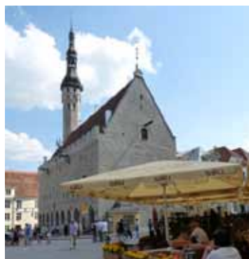
Raekoja Platz y Ayuntamiento

Ya por mi cuenta volví a recorrer toda la parte antigua. Comencé por subir a la torre de la IGLESIA DE SAN OLAF , famosa porque durante parte de los siglos XVI y XVII tuvo el honor de ser la construcción más alta del mundo. Hoy no conserva esas dimensiones ya que ha sido destruida y reconstruida en numerosas ocasiones variando la altura. Por estas vistas se paga 2 euros (y pasas un mal rato si tienes vértigo). Aunque esta iglesia es lo más interesante de la CALLE PIKK tenemos que recorrer la calle entera para ver sus casas gremiales.