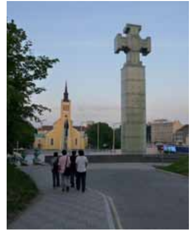
Plaza de la Libertad