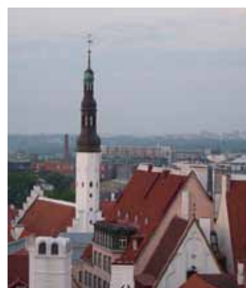
Vistas desde Toompea