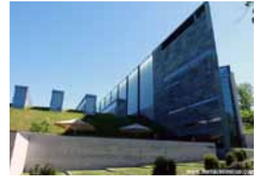
Plaza de la Libertad

El edificio del KUMU también es arte en sí.