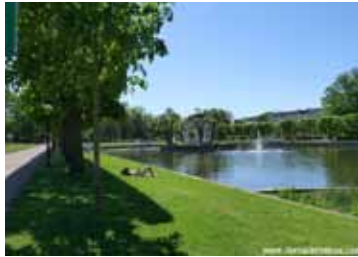
Pasaje de Santa Catalina

KUMU está cerca y es muy recomendable. Fue museo europeo del año en 2008 y a parte de pinturas de las Vanguardias, sobre todo de artistas estonios, su interior recoge alguna obra impactantes. La que más me sorprendió fue la de la artista serbia Tanja Ostojic y su proyecto "Buscando un marido con pasaporte europeo". Tanja publicó en el año 2.000 una fotografía suya en la que aparece desnuda y rapada y recibió cientos de ofertas matrimoniales. Se casó con un alemán