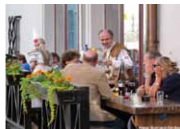
Camareros con trajes de época

Para ver sus comidas típicas me acerqué hasta el mercado de la estación de tren. En su interior los puestos tenían multitud de tartas, panes y lo que yo me compré: una especie de croqueta que resultó ser pan relleno de cebolla frita. El problema y a la vez lo divertido es que los tenderos no hablan inglés. Si quieres probar algo... ¡suerte!