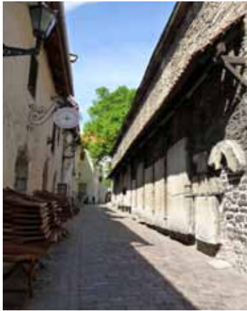
Pasaje de Santa Catalina