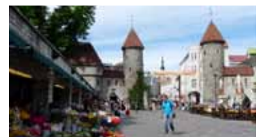
Mercado de las flores y puerta

Sin alejarme demasiado llegué hasta uno de los rincones más fotografiados de Tallin, el CALLEJÓN DE SANTA CATALINA con sus estudios artesanales y las ruinas de un convento. Si lo atravesamos nos encontramos con la calle Müürivahe donde se ubica durante todo el año un mercadillo textil artesanal, justo pegado a la muralla. Llegamos a la esquina de Müürivahe con la calle Viru, aquí podemos ver una de las PUERTAS más famosas de la ciudad y ya fuera de la muralla el animado MERCADO DE LAS FLORES .