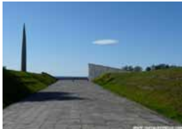
Memorial de Maarjamäe

que casi todos los autobuses que pasan por allí llevan hasta el centro (Viru Kerku).