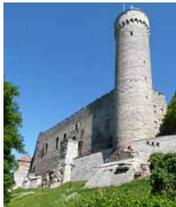
Torre del Parlamento