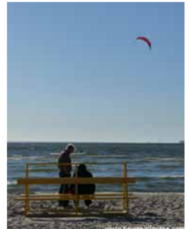
Playa de Pirita