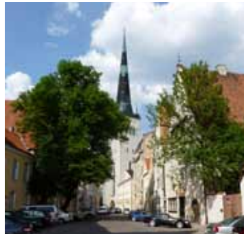
La calle Pikk y la iglesia de San Olaf