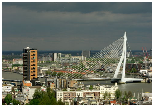
por: Jacqueline ter Haar

Ha llegado el momento de conocer la segunda mayor ciudad del país. Famosa por el hecho de poseer uno de los mayores puertos del mundo, Róterdam es también una metrópolis vibrante y un centro cultural y económico con mucho que ofrecer. Disfrute de grandes eventos, espléndidas compras, una vida nocturna salvaje y los impresionantes deleites de la arquitectura moderna.