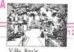
Villa Reale di Marlia